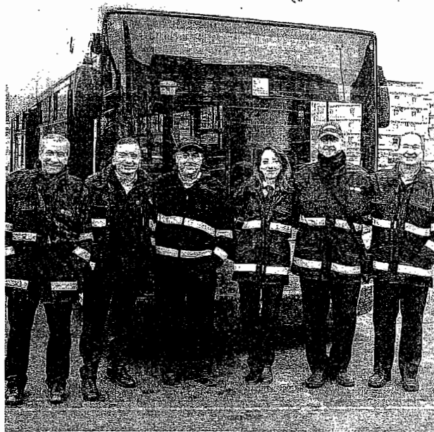
La conducente con alcuni colleghi. La sua attività da dipendente dell'Amt è cominciata nel 2014, 9 anni dopo aver partecipato al concorso